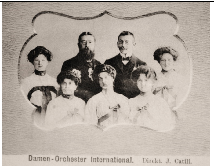
Damen-Orchester International. Direkt. J. Catili.