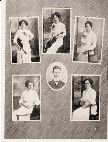
Wiener Damen-Orchester „Donaperlen“ Dir.: H. A. Leptien