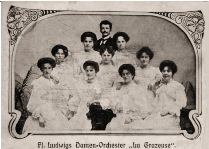
Fl. Ludwigs Damen-Orchester „La Grazeuse“. Damen-Orchester "La Grazeuse" - Fl. Ludwig