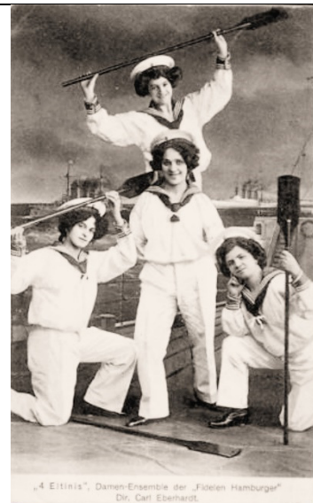
Damen-Ensemble der "Fidelen Hamburger" "4 Eltinis"