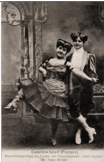
Geschwister Floretti - Damen-Gesangs-Duett des Variété und Possen Ensemble "Fidele Sachsen"