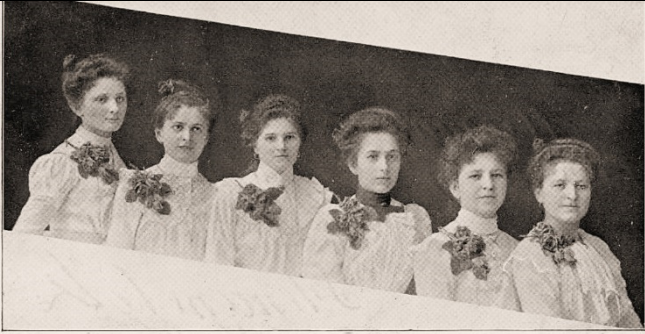
D'Carlsbader, Damen-Concert-Orchester. Dir. F. Pfanner.