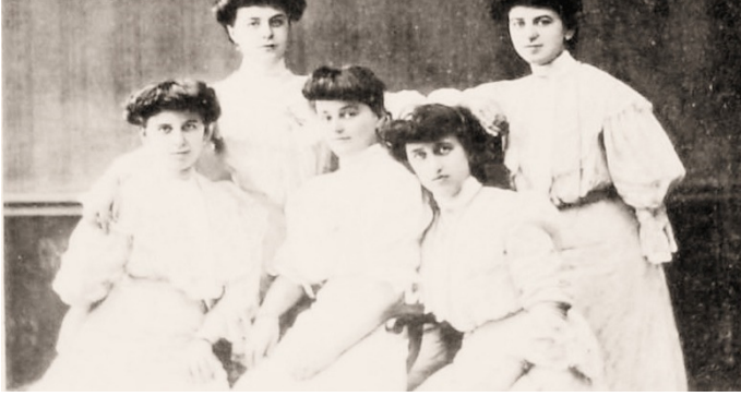
Wiener Damen-Concert-Orchester - Ad. Burian