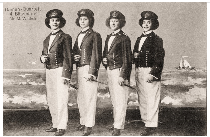
Damen-Quartett 4 Blitzmädel Dir. M. Witthein