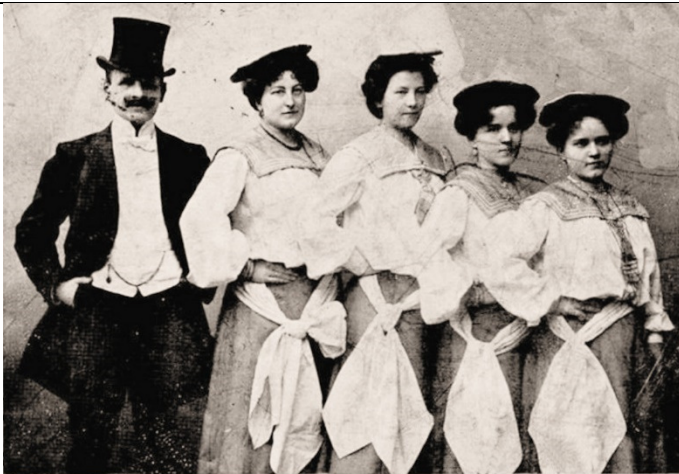
Internat. Musik- u. Gesangs-Damen-Ensemble „Dina“ Musik und Gesangs Damen-Ensemble "Dina" J. Karl Bauer (1907)