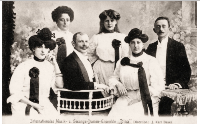
Internationales Musik- u. Gesangs-Damen-Ensemble „Dina“ Direction: J. Karl Bauer.