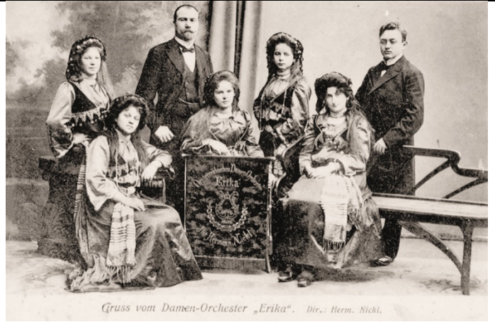
Gruss vom Damen-Orchester „Erika“. Dir.: Herm. Nickl.