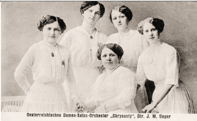
Oesterreichisches Damen-Salon-Orchester „Chrysanty“, Dir. J. M. Unger