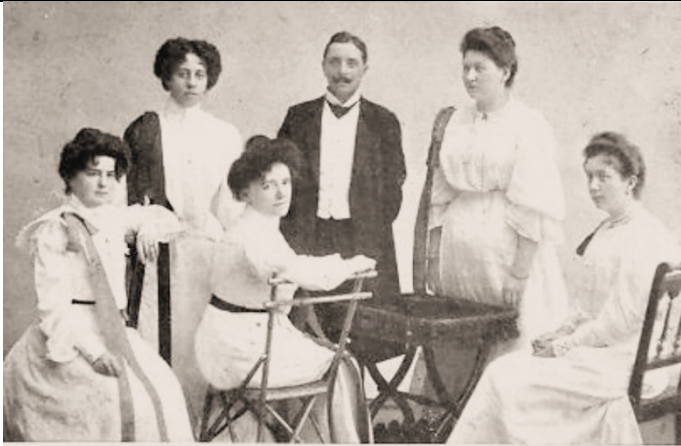
Oesterreichisches Damen-Orchester „Amorosa“ Direktion: Ferd. Sonntag.