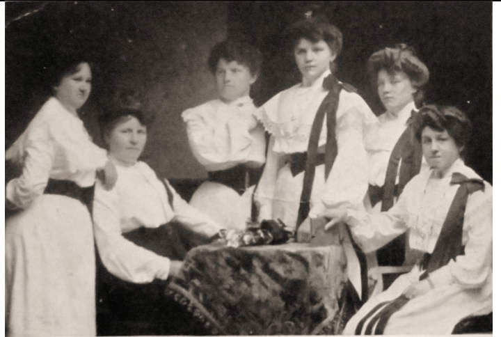
Österreichisches Damen-Orchester „Aida“. Dir.: A. Langer.