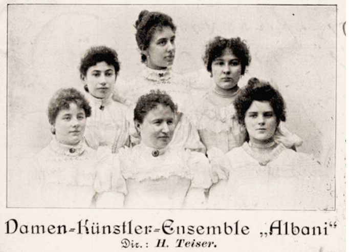
Damen-Künstler-Ensemble „Albani“ Dir.: H. Teiser.