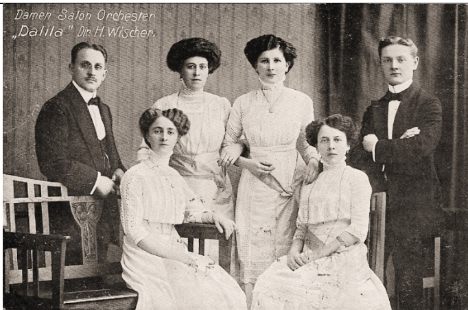
Damen Salon Orchester "Dalila" - H. Wischer (1913)