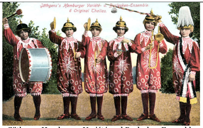
Gäthgens's Hamburger Variété- u. Burlesken-Ensemble. 6 Original Thalias.