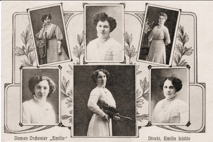
Damen Orchester „Emilia“