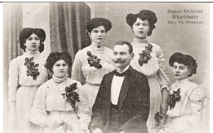
Damen-Concert-Orchester "D'Karlsbader" - F. Pfanner (1910)