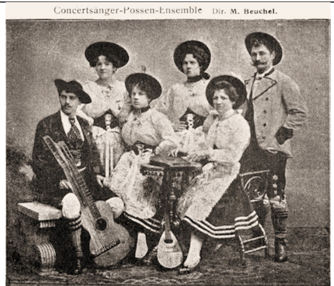
Concertsänger-Possen-Ensemble Dir. M. Beuchel.