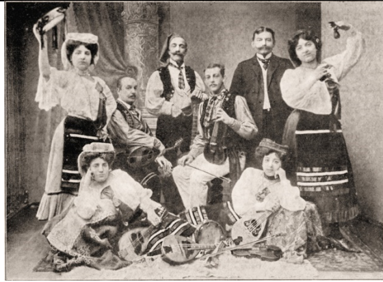
Gruss von der Italienischen « » Kapelle „La Fortuna“ Dir.: Gennaro Colentino