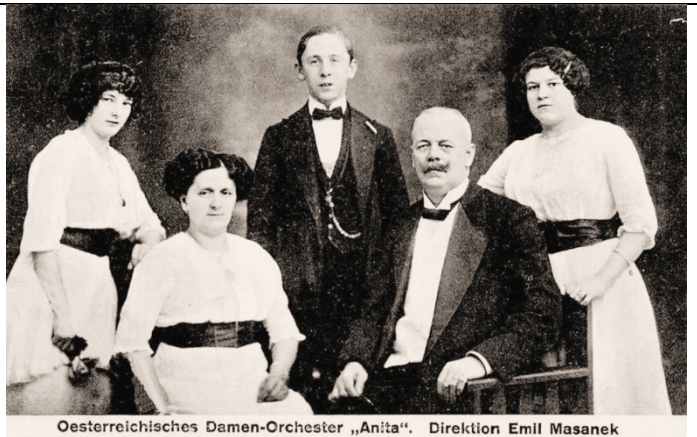
Österreichisches Damen-Orchester „Anita“. Direktion Emil Masanek