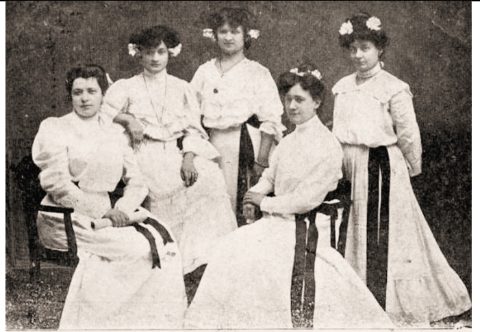
Wiener Damen-Ensemble „Carla“.