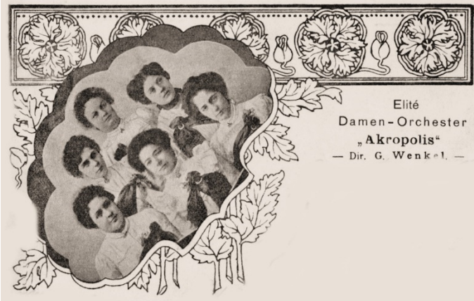
Elité Damen-Orchester „Akropolis“ — Dir. G. Wenkel. —