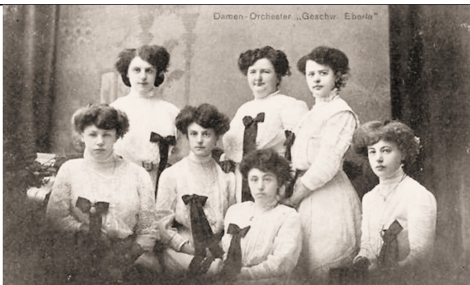
Damen-Orchester „Geschw. Eberle“