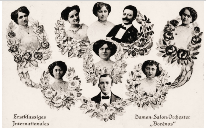
Erstklassiges Internationales Damen-Salon-Orchester „Borénos“