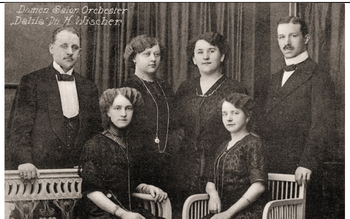
Damen Salon Orchester "Dalila" - H. Wischer (1913)