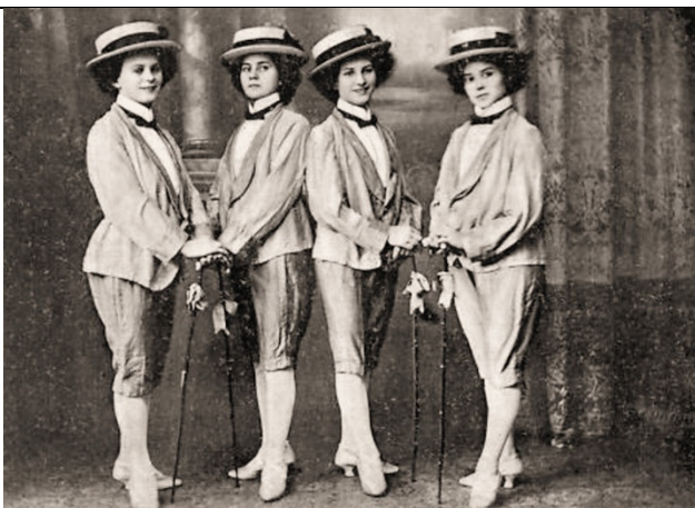
Damen-Quartett 4 Blitzmädel Dir. M. Witthein