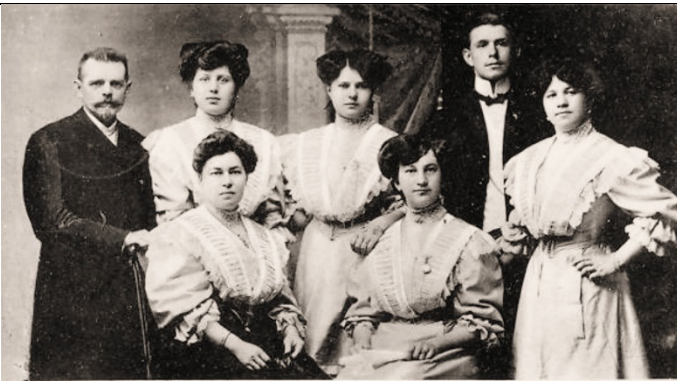
Oesterr. Damen-Orchester „Frühlingskinder“, Direkt.: Ed. Schiller.