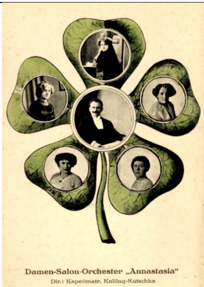
Damen-Salon-Orchester „Annastasia“ Dir.: Kapellmstr. Kolling-Kutschka