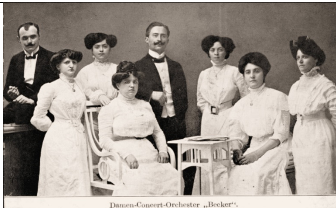
Damen-Concert-Orchester „Becker“. Damen-Concert-Orchester "Becker"