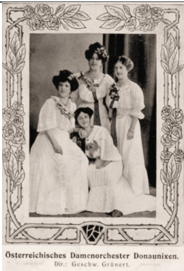
Österreichisches Damen-Orchester Donaunixen. Dir.: Geschw. Grünert.