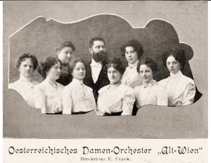
Damen-Orchester "Alt Wien" - E. Frank