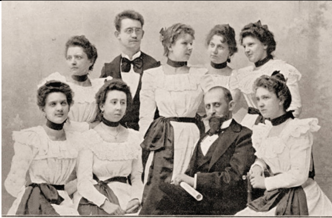
Damen-Orchester „Th. Aust“.