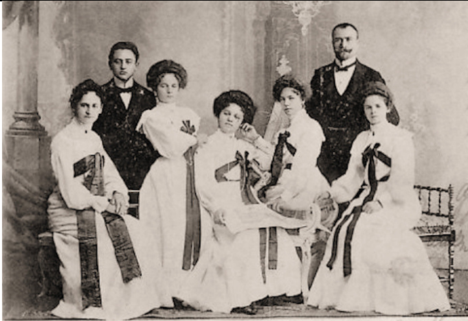
Gruss vom Damen-Orchester „Erika“. Dir.: Herm. Nickl.