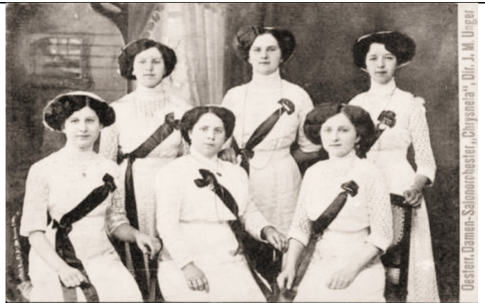
Oester. Damen-Salonorchester „Chrysnela“, Dir. J. M. Unger