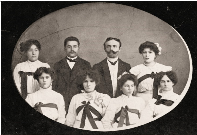
Elite Damen-Orchester „Estudiantina“, Dir.: H. Ehrlich.