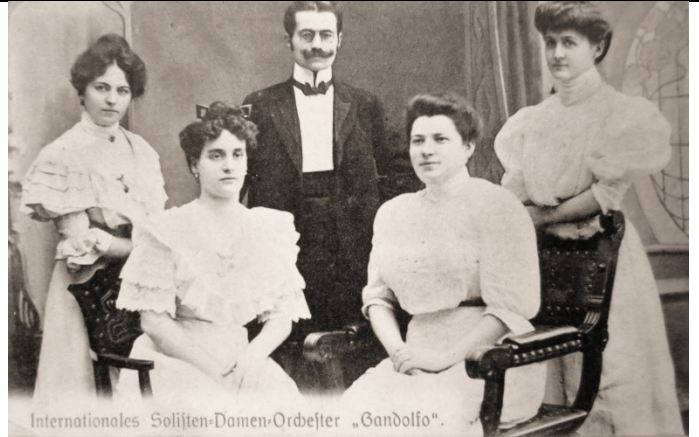
Internationales Solisten-Damen-Orchester "Gandolfo". Internationales Solisten-Damen-Orchester "Gandolfo" (1903)