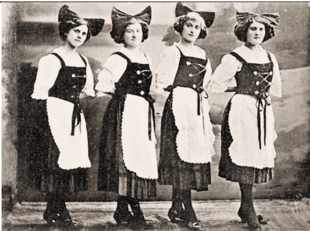
Thümmel-Selton Damen-Ensemble „Die Bertanos“ I. Leipziger Variété-Ensemble