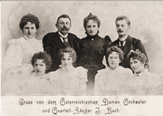
Damen Orchester und Quartett-Sänger – J. Bach (1899)