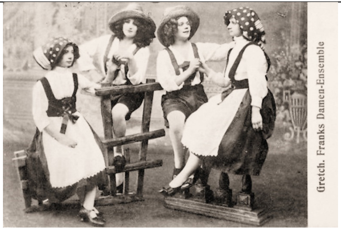
Gretch. Franks Damen-Ensemble