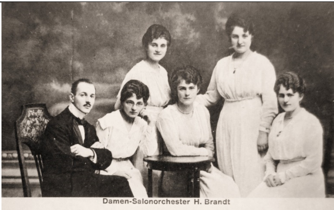
Damen-Salonorchester H. Brandt