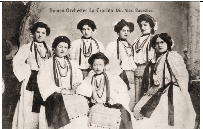
Damen-Orchester La Czarina Dir. Alex. Rauscher.