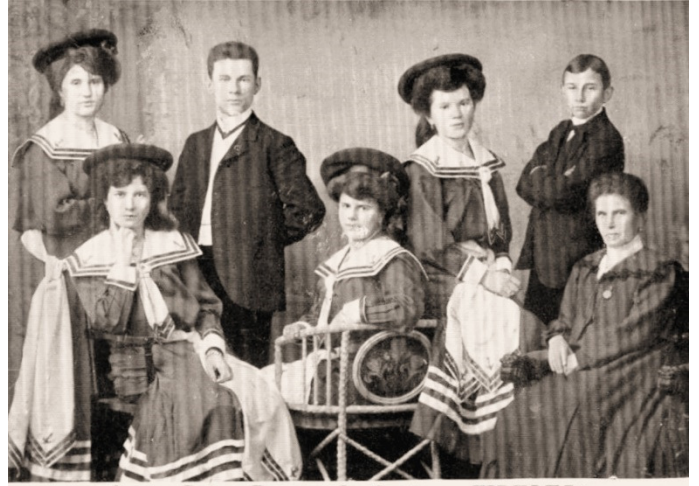
Oest. Salon-Damen-Orchester „FIDELES“