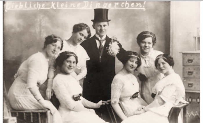
Liebliche kleine Dingerchen