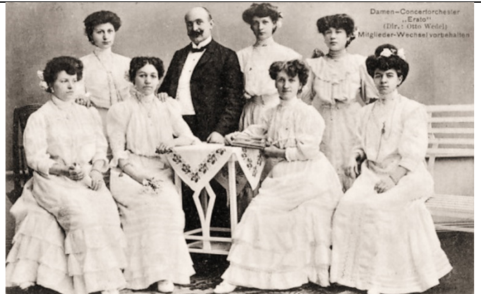
Damen-Concertorchester „Erato“ (Dir.: Otto Wedel) Mitglieder-Wechsel vorbehalten