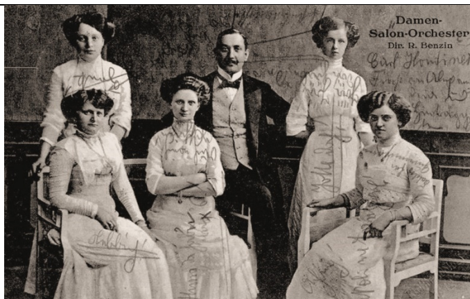
Damen Salon Orchester – R. Benzin