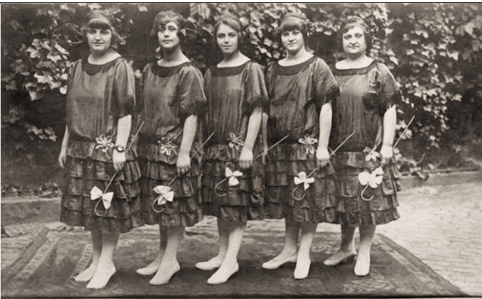
Damen-Blas-Orchester u. Gesangs-Ensemble „Carmen-Silva“ Dir. P. J. Nentwig Ständige Adresse, Hamborn a. Rh, Marthastr. 9