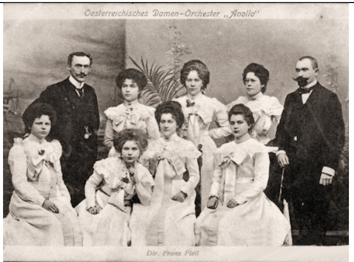
Österreichisches Damen-Orchester „Apollo“