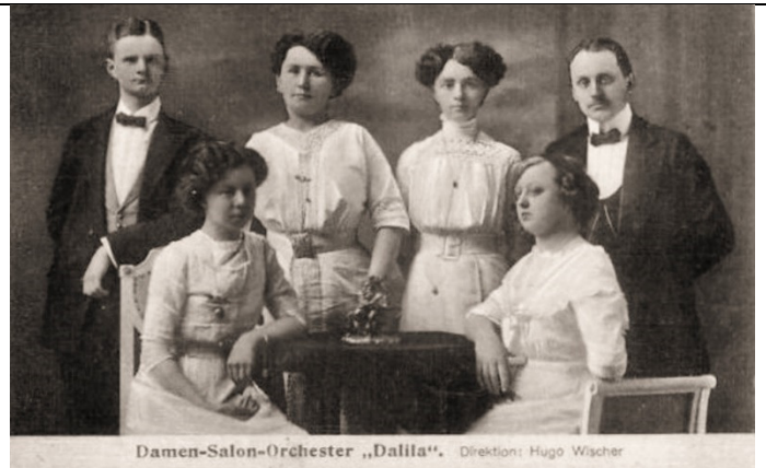
Damen Salon Orchester "Dalila" - H. Wischer (1913)