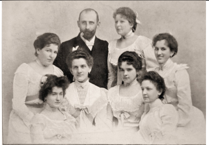
Dam.-Orch. „Germania“ Dir.: Th. Aust.