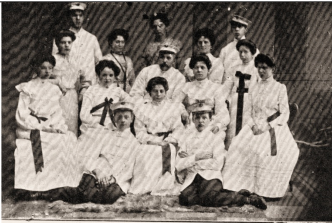
Damen-Orchester „Germania“ Dir.: W. Pfarr.