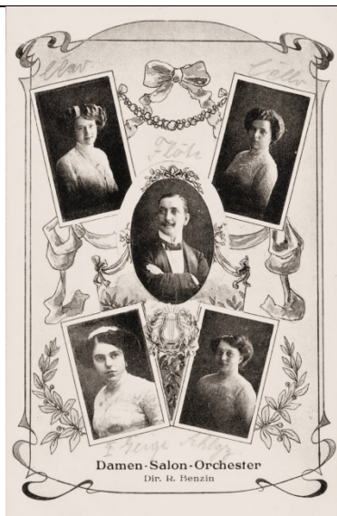
Damen Salon Orchester – R. Benzin