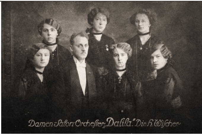
Damen Salon Orchester "Dalila" - H. Wischer (1913)