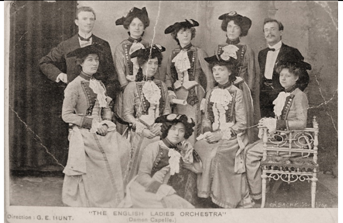
Direction : G. E. HUNT.