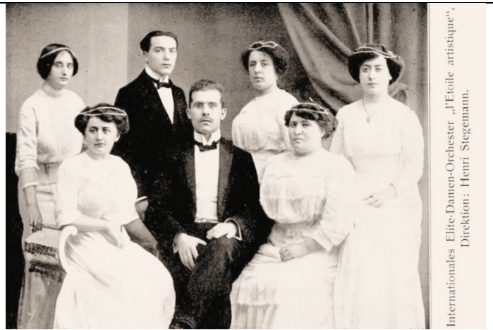
Internationales Elite-Damen-Orchester „L'Etoile artistique“, Direktion: Henri Stegemann.