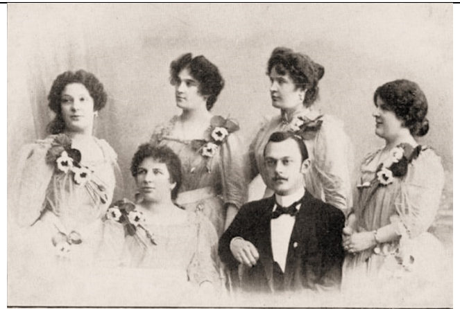
Österreichisches-Damen-Orchester „Donaunixen“ Direction: Richard Perzel.