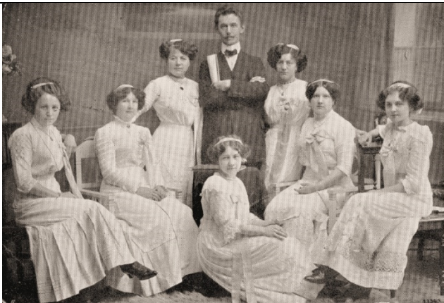
Wiener Damen-Orchester „Donaperlen“ Dir.: A. H. Leptien