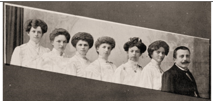
Elite Damen-Orchester „Kreuzfidel“. :: Dir.: G. Boitmann. Elite Damen-Orchester "Kreuzfidel" - G. Boitmann (1910)