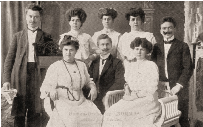
Damen-Orchester "Norma" - Joh. Hecker