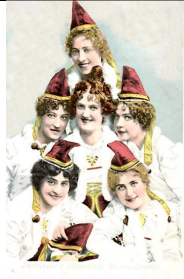
Poettinger's schwedische Damen Sextett