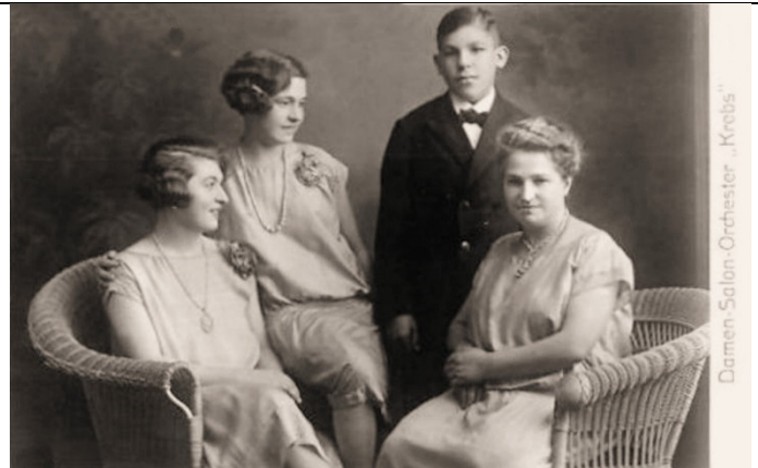
Damen-Salon-Orchester "Krebs" (1927)