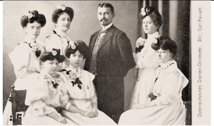
Oesterreichisches Damen-Orchester. Dir.: Carl Peinelt.