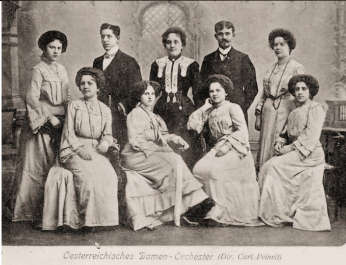
Oesterreichisches Damen-Orchester (Dir. Carl Peinelt)