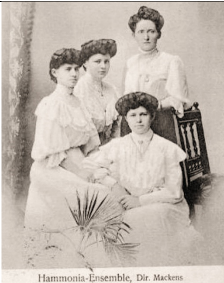
Hammonia-Ensemble, Dir. Mackens