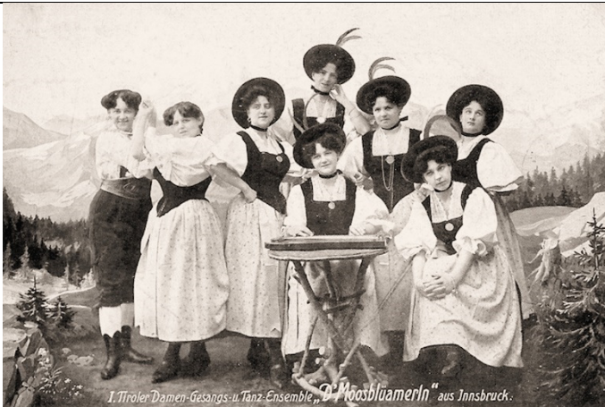
1. Tiroler Damen-Gesangs- u. Tanz-Ensemble „D' Moosblüamerln“ aus Innsbruck.