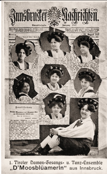
1. Tiroler Damen-Gesangs- u. Tanz-Ensemble „D'Moosblüamerln“ aus Innsbruck.