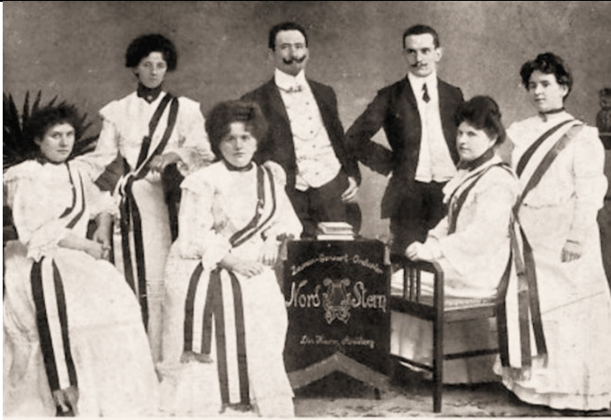
Damen-Konzert-Orchester Direktion: Herm. Amelang. Damen-Konzert-Orchester "Nord Stern" - H. Amelang