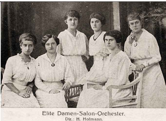
Elite Damen-Salon-Orchester. Dir.: H. Hofmann.