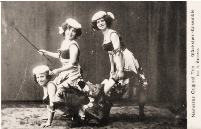
Namieras Original Trio Glückstern-Ensemble Dir. G. Reimann