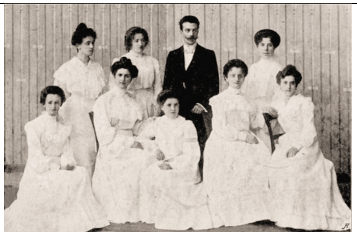
Oesterr. Damen-Orchester „La Paloma“ Direktion: A. Neugebauer.