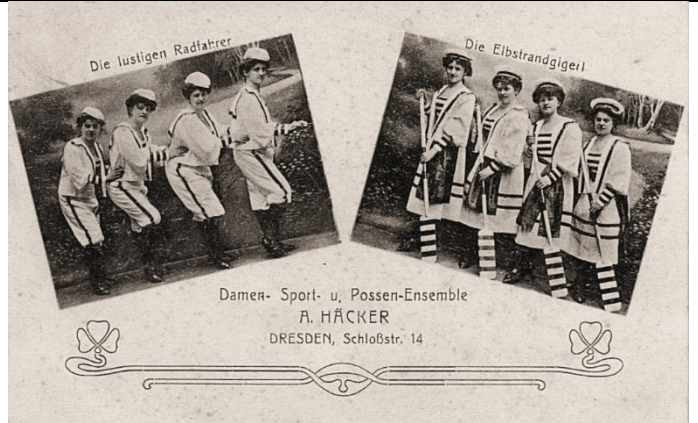
Damen Verwandlungs Ensemble – Häcker