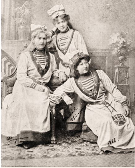
Stockholmer Damen-Terzett, Dir. J. Hossfeld.