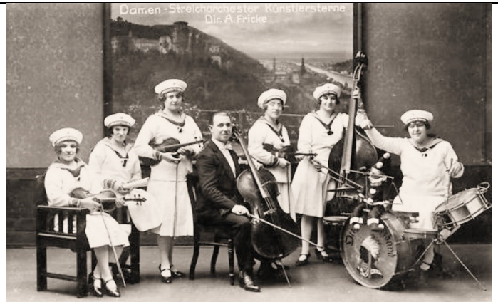
Damen-Streichorchester "Künstlersterne" - A. Fricke