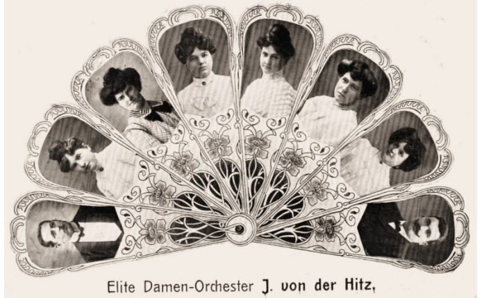
Elite Damen-Orchester J. von der Hitz, Elite-Damen-Orchester - J. von der Hitz (1909)