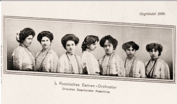
Damen-Orchester "Koschinka" [founded in 1899]