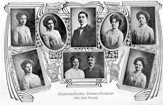
Oesterreichisches Damen-Orchester (Dir. Carl Peinelt)