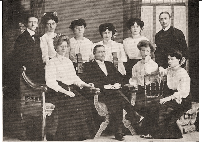
Damen-Kapelle „Hansa“ Dir.: R. Köhler. Damen Kapelle "Hansa" - R. Köhler (1908)