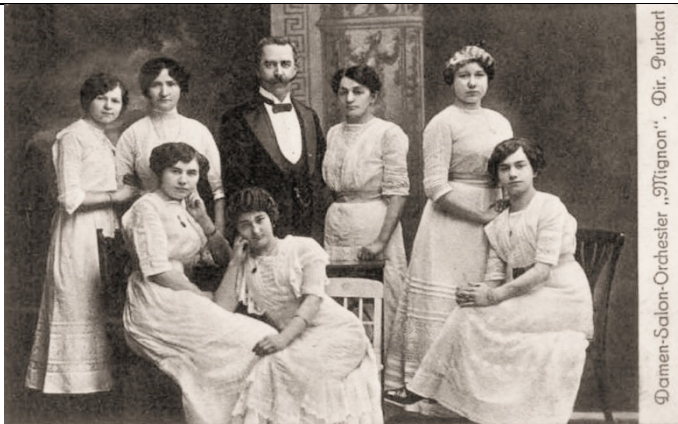
Damen-Salon-Orchester „Mignon“. Dir. Purkart