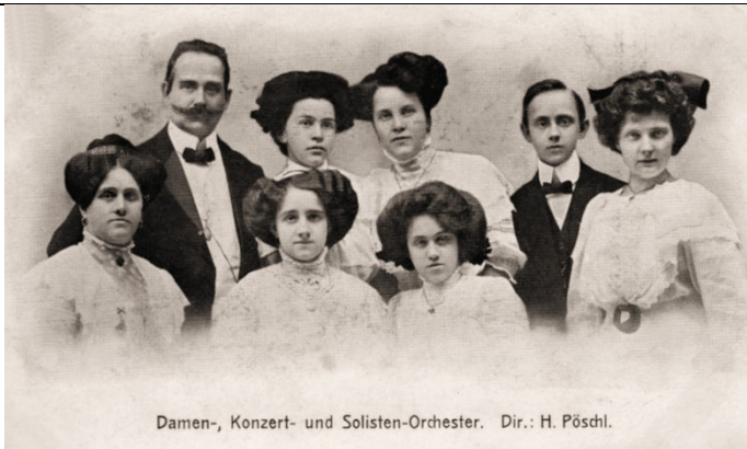
Damen-, Konzert- und Solisten-Orchester. Dir.: H. Pöschl.