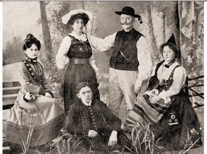
Damen-Orchester „Poppowitsch“ Original schwedische Nationaltracht/ Damen-Orchester "Poppowitsch" (1907)