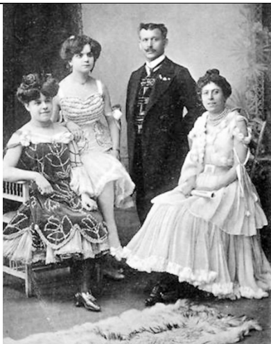
Erstes Mülhauser Gesangs-, Spezialitäten- u. Possen-Ensemble ••••• Direktion: Harry Schindler •••••