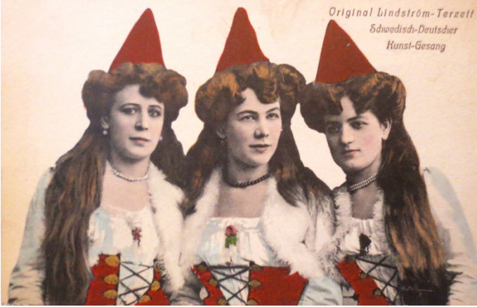
Original Lindström-Terzett Schwedisch-Deutscher Kunst-Gesang