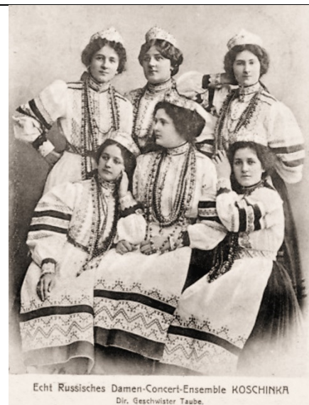
Echt Russisches Damen-Concert-Ensemble KOSCHINKA Dir. Geschwister Taube. Damen-Orchester "Koschinka" [founded in 1899]