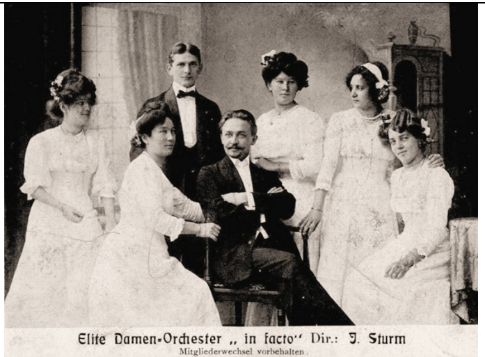
Elite Damen-Orchester „in fact“ Dir.: J. Sturm Mitgliederwechsel vorbehalten.