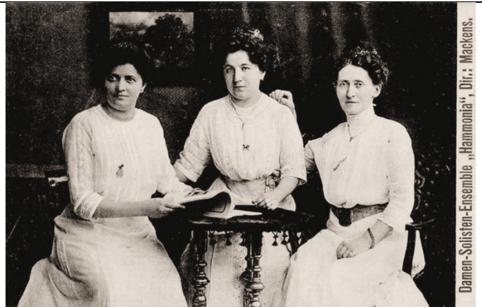
Damen-Ensemble "Hammonia" - J. Wehl & Mackens (1908)