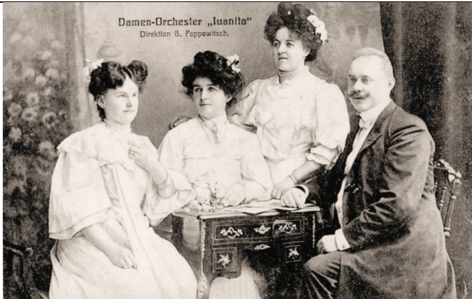
Damen-Orchester "Iuanita" - G. Poppowitsch (1907) [also known as Damen-Orchester "Poppowitsch"]