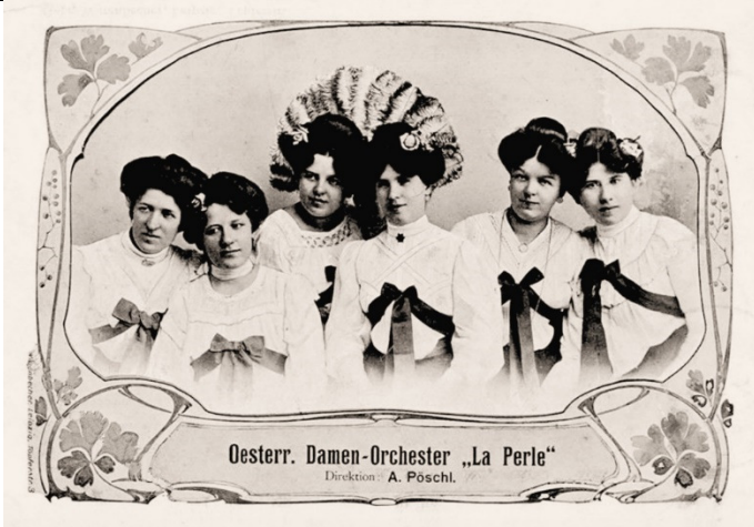
Oesterr. Damen-Orchester „La Perle“ Direktion: A. Pöschl.