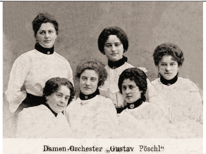
Damen-Orchester „Gustav Pöschl“ Damen-Orchester "Gustav Pöschl" - Gustav Pöschl