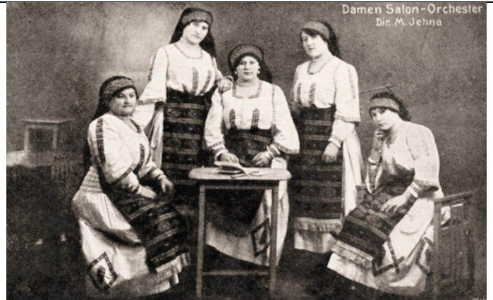
Damen Salon-Orchester Dir. M. Jehna