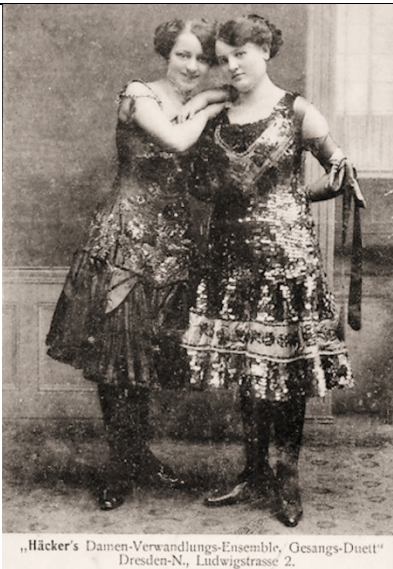
„Häcker's Damen-Verwandlungs-Ensemble, Gesangs-Duett“ Dresden-N., Ludwigstrasse 2.