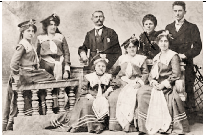
Oesterr. Damen-Orchester „Isolde“