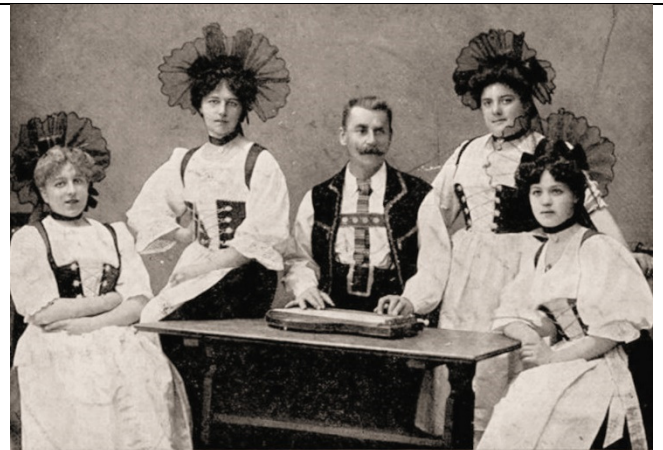
Alpines Damen-Gesangs-Ensemble „D'Moosröserln“ Dir.: J. Reiter.