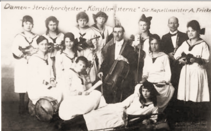
Damen-Streichorchester "Künstlersterne" - A. Fricke