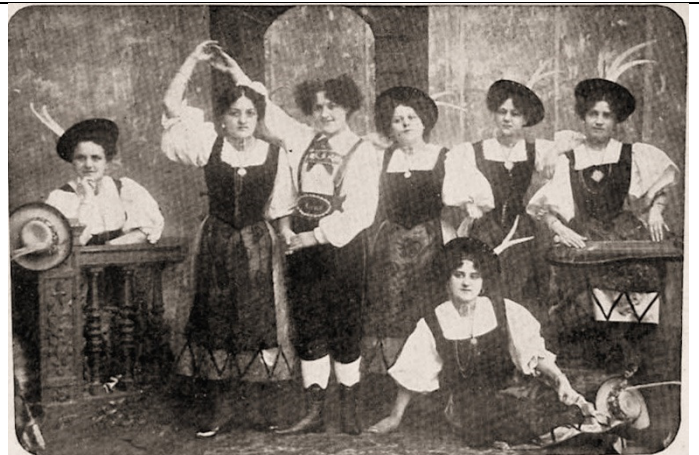
Oesterreichisches Damen-Gesangs-Ensemble „D' Moosblüamerln.“