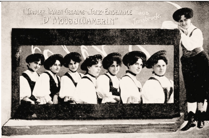
Damen-Gesangs und Tanz Ensemble "D'Moosblüamerln"