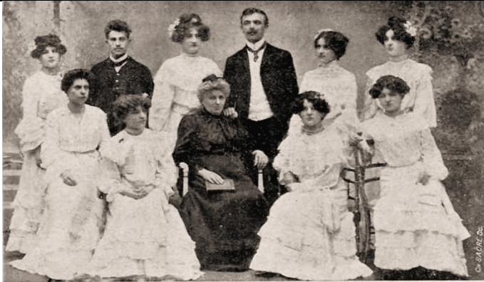
ELITES - DAMEN - ORCHESTER FAMILIE KREUZIG Elite-Damen-Orchester Familie "Kreuzig"