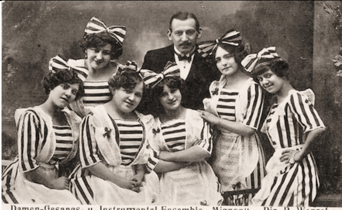
Damen-Gesangs- u. Instrumental-Ensemble „Mignon“. Dir. R. Wenzel.