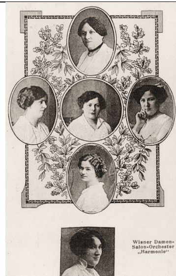
Wiener Damen-Salon-Orchester "Harmonie" (1916)