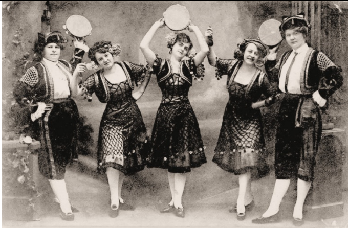
Damen Verwandlungs Ensemble – Häcker Dresden-N, Ludwigstrasse 2