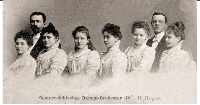
Oesterr. Damen-Orchester (Dir.: H. Heger).