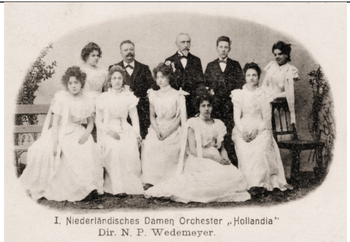
I. Niederländisches Damen Orchester „Hollandia“ Dir. N. P. Wedemeyer. Damen-Orchester "Hollandia" - N.P. Wedemeyer