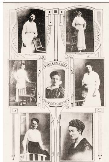
Österr. Erstklass. Damen-Salon-Orchester v. B. S. Haustein