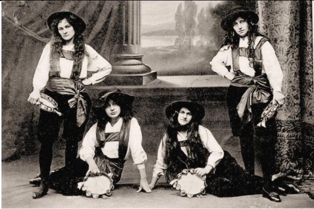
Damen-Ensemble: „Harzer Roller“