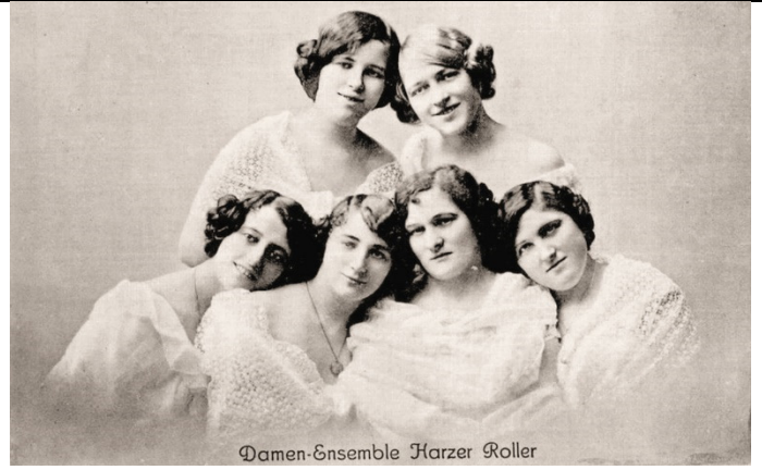
Damen-Ensemble Harzer Roller