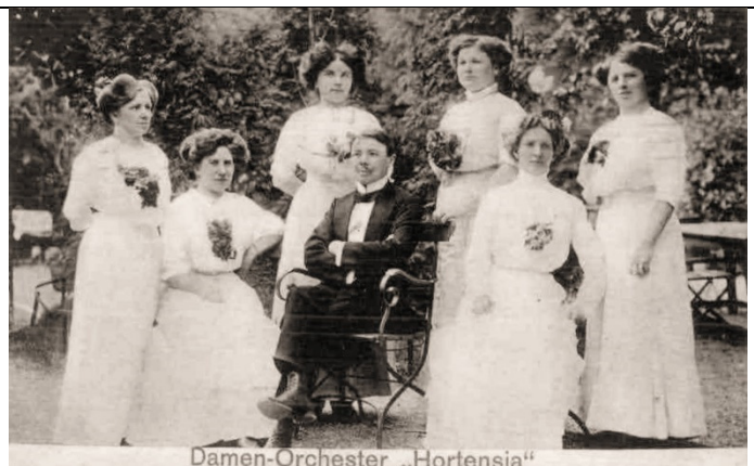
Damen-Orchester „Hortensia“ Damen-Orchester "Hortensia" (1911)