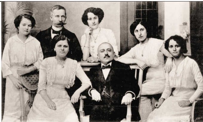
Elite Damen-Orchester „Kreuzfidel“, Dir. G. Boitmann Elite Damen-Orchester "Kreuzfidel" - G. Boitmann (1910)