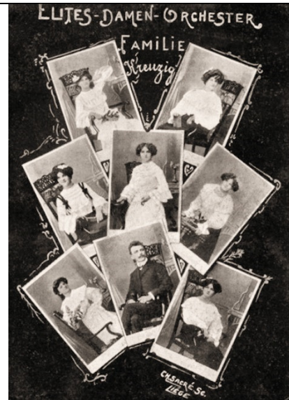
Elite-Damen-Orchester Familie "Kreuzig"