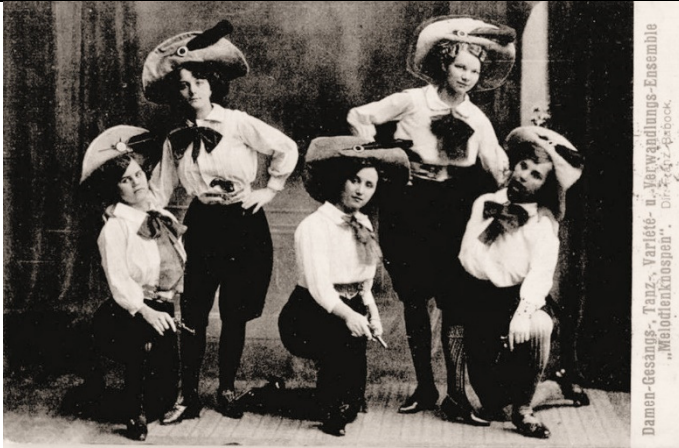
Damen Gesangs-, Tanz, Varieté-, und Verwandlungs Ensemble "Melodienknospen" - Franz Babcock