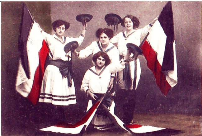
Damen-Ensemble „Harzer Roller“