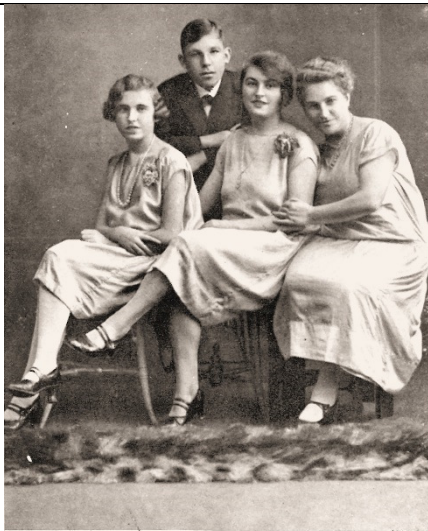
Damen Salon-Orchester „Krebs“ Damen-Salon-Orchester "Krebs" (1927)