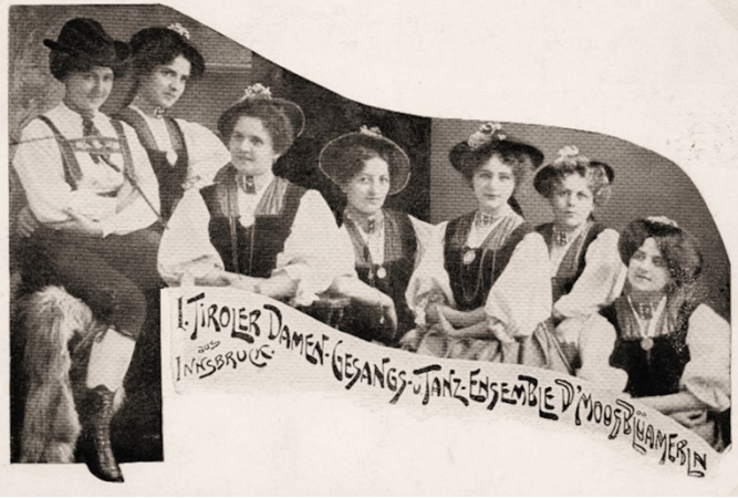
Damen-Gesangs und Tanz Ensemble "D'Moosblüamerln"