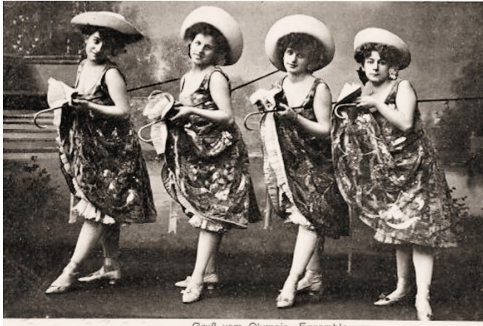
Grüß vom Olympia-Ensemble