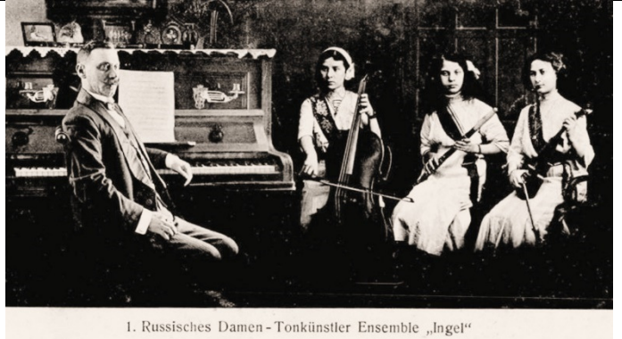
I. Russisches Damen-Tonkünstler Ensemble „Ingel“