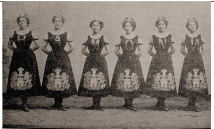
Damen-Ensemble „Hammonia“ aus Hamburg (Direktion J. Wehl)!